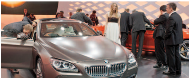
BMW Erlebnisswelt München

Geurmoleculen prikkelen de geurreceptoren in de neus. De betreffende prikkels worden doorgestuurd naar de hypothalamus en het limbisch systeem, het gedeelte van de hersenen dat fungeert als centrum van onze emoties. Wanneer de 'juiste geur' in de lucht hangt, voelen medewerkers, gasten en klanten zich prettiger en zijn ze gemotiveerder. Ze kunnen zich beter concentreren en presteren beter.